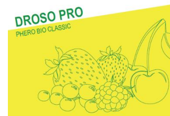
Pheromone dispenser against Drosophila Suzukii